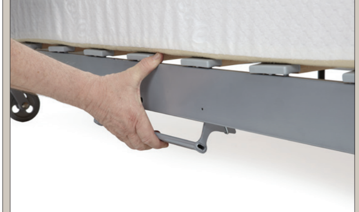
MANIGLIA BLOCCO CHIUSURA E APERTURA. OPENING AND CLOSING LOCK HANDLE.