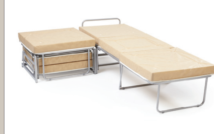
COMPOSIZIONE GEMELLARE. TWIN BED COMPOSITION.