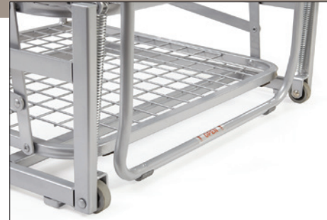
VERSIONE CON RUOTA CODICE JUST800RP. AVAILABLE WITH WHEELS CODE JUST800RP.