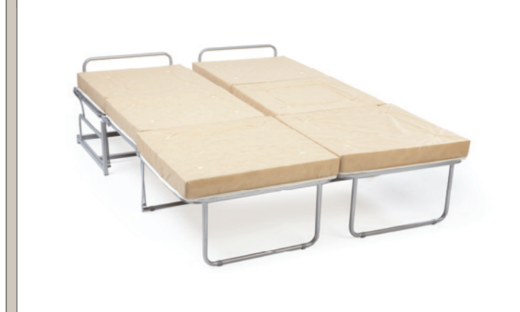
COMPOSIZIONE GEMELLARE. TWIN BED COMPOSITION.