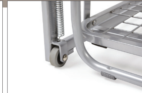
VERSIONE CON RUOTA CODICE JUST800RP. AVAILABLE WITH WHEELS CODE JUST800RP.