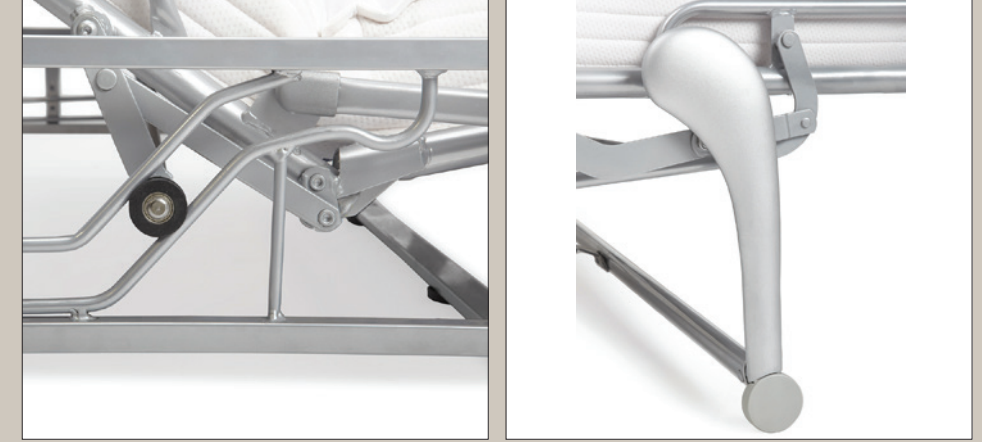
PARTICOLARE DESIGN DEL PIEDE NEW FOOT DESIGN