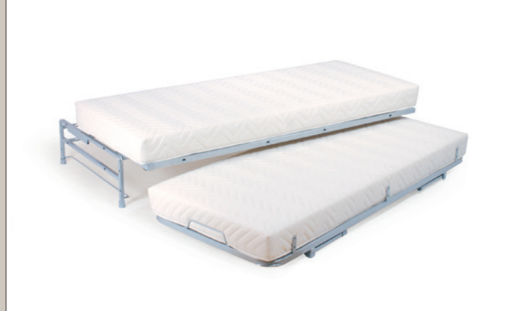
MECCANISMO CON PIANO AVANZATO PER DISIMPEGNO SCHIENALE E BARELLA SOLLEVATA ALLA STESSA ALTEZZA TRAMITE PIEDI. MECHANISM WITH PROGRESSING PLANE TO FREE THE BACK AND LIFTING BED TO THE SAME LEVEL OF THE UPPER ONE.