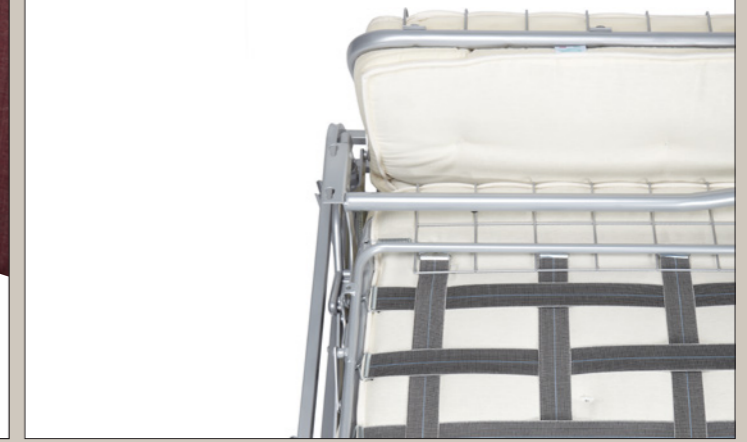
CINGHIA ELASTICA SE SEDUTA A RICHIESTA SEAT BELTS AVAILABLE ON REQUEST